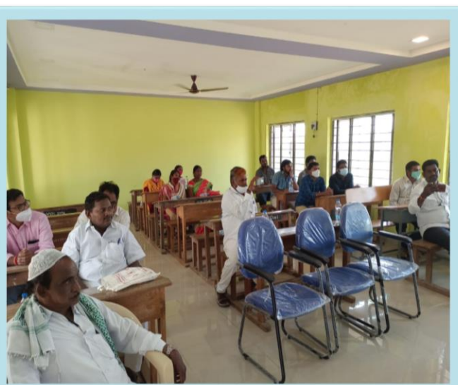
Alumni Association Members